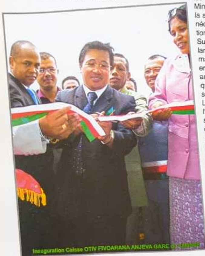
Inauguration Calase OTIV FIVOARANA ANJEVA GARE QU'ANTANANARIVO

Propos recueillis par Jean Bosco RANDRIANJARA