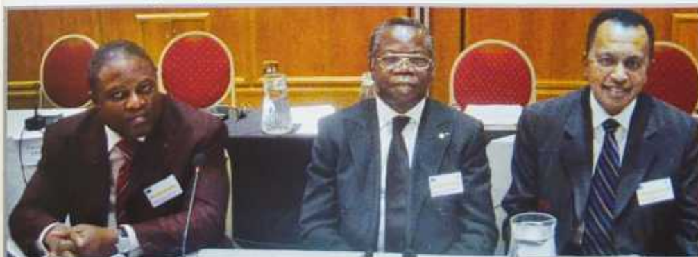
Honourable MAHAZAKA Clermont with the delegate of the Democratic Republic of Congo