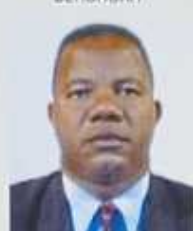
REMAHITA Désiré ATSIMO-ATSIANANA BEFOTAKA SUD