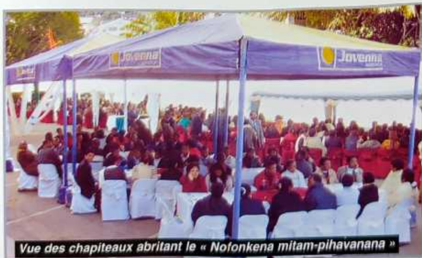
Vue des chapiteaux abritant le « Nofonkena mitam-pihavanana »