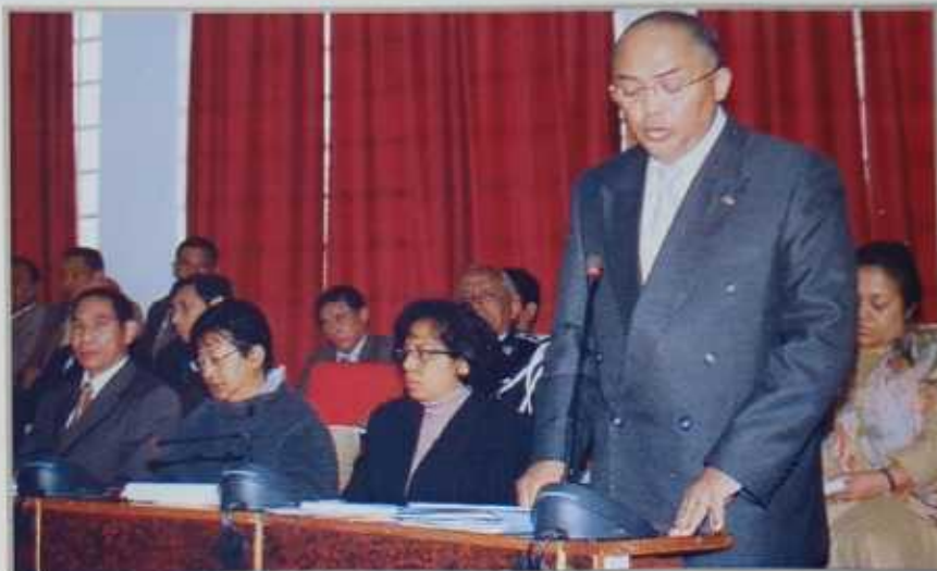
Les membres du Gouvernement à l'Assemblée nationale avec le Premier Ministre Charles RABEMANANJARA

Les actions menées par le Ministère sont alignées au MAP. Engagement n°1 « Gouvernance Responsable » et Engagement n°2 « Solidarité Nationale ». Quelques réalisations : - Réorganisation et sécurisation de la filière des bovidés (système d'élevage et de commercialisation) ; - Programme « Opérations de recensement administratif national de réhabilitation de l'état civil et de dotation d'actes de naissance à tous les citoyens ».