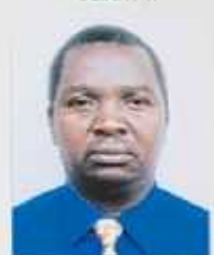
LERIVA Manahirana ATSIANANA BRICKAVILLE