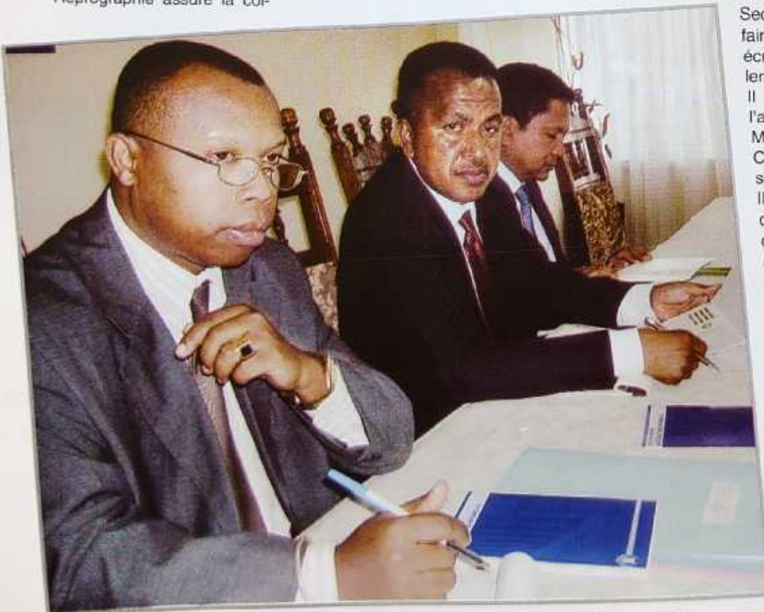
Le Secrétaire Général avec les membres du Bureau Permanent lors d'une réunion