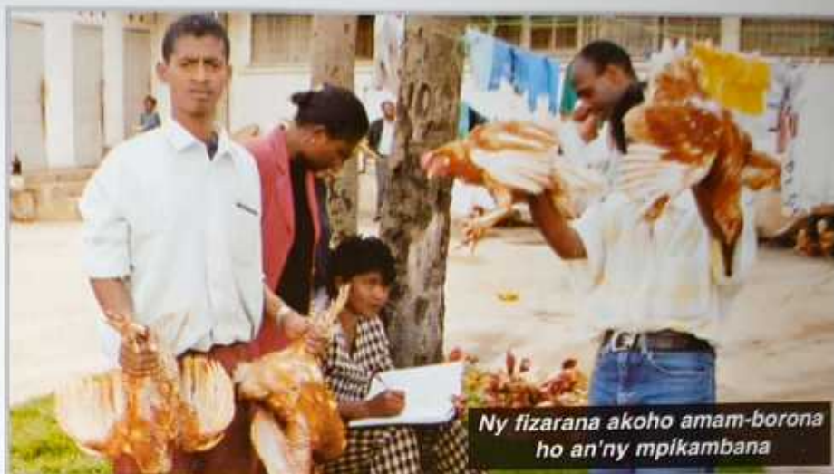
Ny fizarana akoho amam-borona ho an'ny mpikambana

Solombavambahoaka sy ireo mpiasa vit-sivitsy mbola tsy resy lahatra hitondra ny anjara birikiny, mba hifanohana sy hifanampy hampiroboroboantsika ity fikambanana ity.