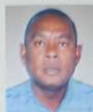
TSITDHERY A. André ATSIMO-ANDREFANA BETIOKY ATSIMO