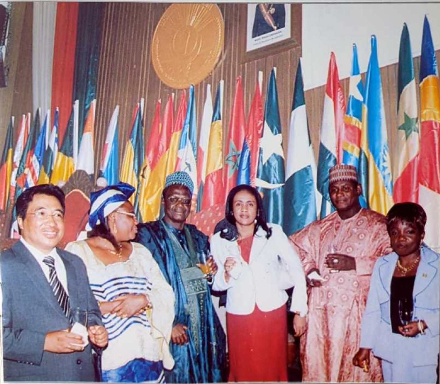
Deux membres du BP avec les délégués du Niger et du Gabon