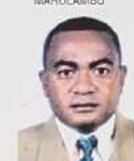
ANDRIAMBOLDLONA Barison C. BETSIBOKA KANDREHO