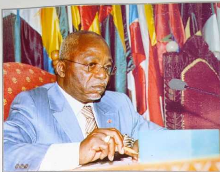
SEM Guy NZOUBA-NDAMA, Président de l'Assemblée nationale du Gabon et Président de l'APF

Plusieurs cadres de concertation sur différentes filières de l'économie (agriculture, élevage et pêche, ...) ont été mis en place avec un dispositif sur les négociations économiques internationales.