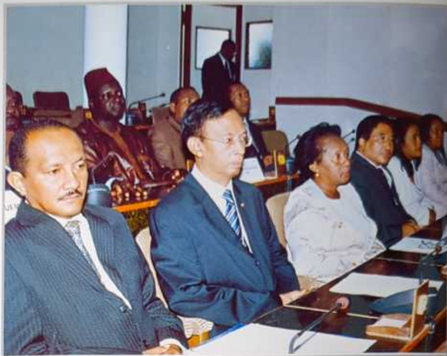
La délégation du Parlement de Madagascar

Il a pris l'exemple de son pays, le Sénégal, avec le Programme GOANA, d'un coût de 875 millions de dollars américains, dont le mot d'ordre est « consommons ce que nous produisons et produisons ce que nous consommons ».