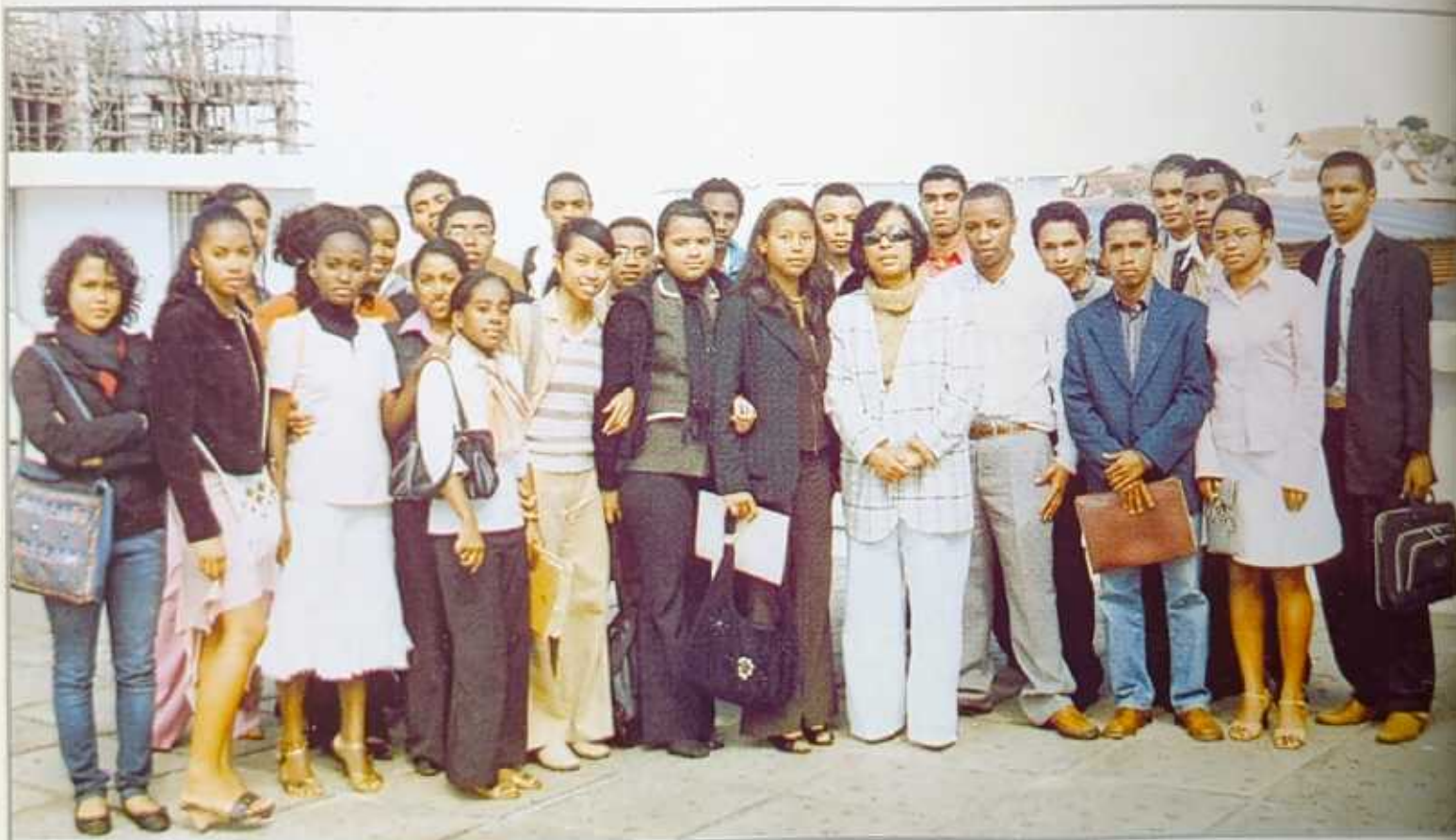
Visite des étudiants de l'Engineering School of Tourism, Informatics, Interpretership and Management, IESTIM, à l'Assemblée nationale pendant la première Session