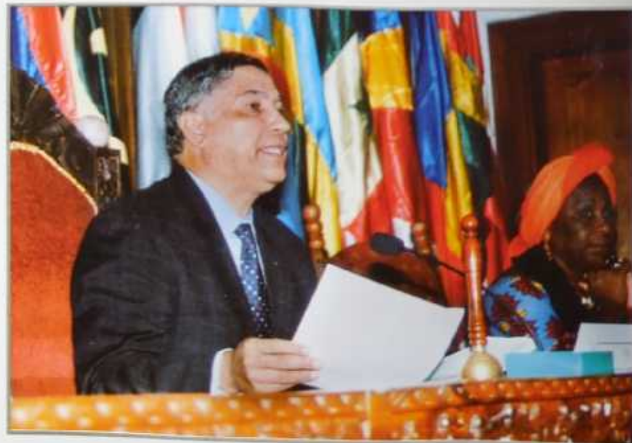
SEM Jacques SYLLA - Président de l'Assemblée nationale de Madagascar et Président de la Section Malgache de l'APF dirigeant les travaux