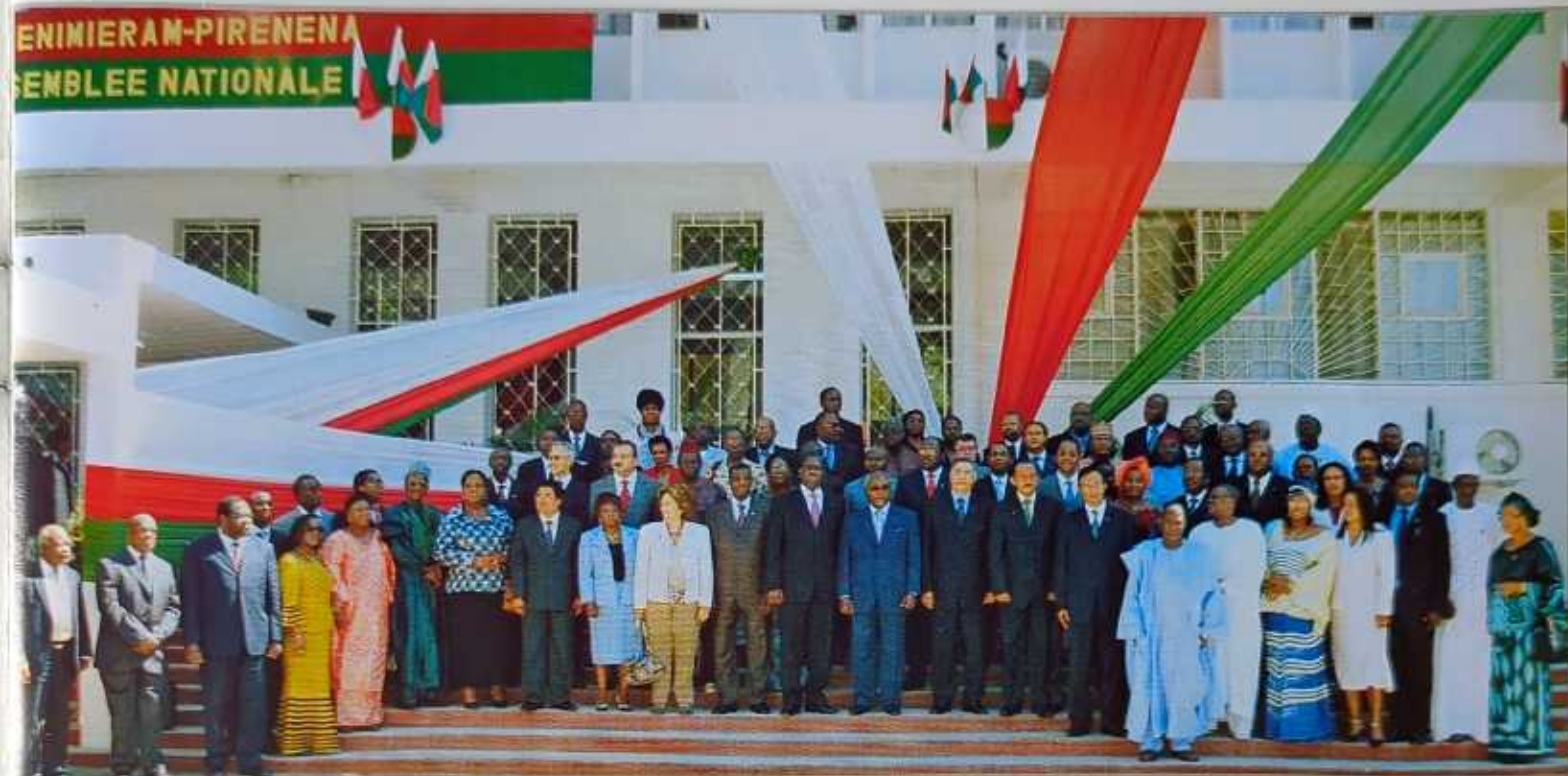
Les participants à l'Assemblée Régionale Afrique de l'Assemblée Parlementaire de la Francophonie à Antananarivo 14,15,16 mai 2008

P lus de 80 délégués ont participé à la rencontre, dont des observateurs issus de la Région Europe, du Parlement Panafricain, du Comité Interparlementaire de l'Union Economique et Monétaire Ouest-Africaine (UEMOA) et celui de la Communauté Economique et Monétaire de l'Afrique Centrale (CEMAC).