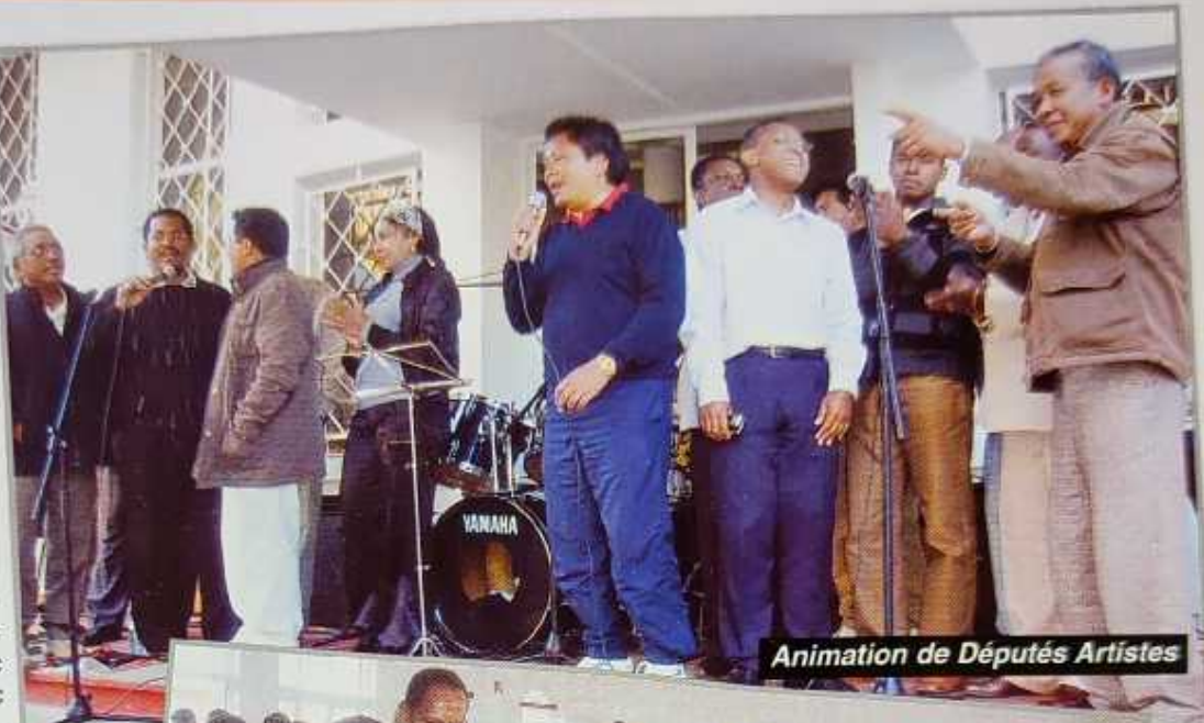
Animation de Députés Artistes