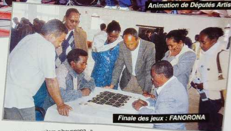
Finale des jeux : FANORONA

« Nofonkena mitam-pihavanana » commença par l'Hymne national, les