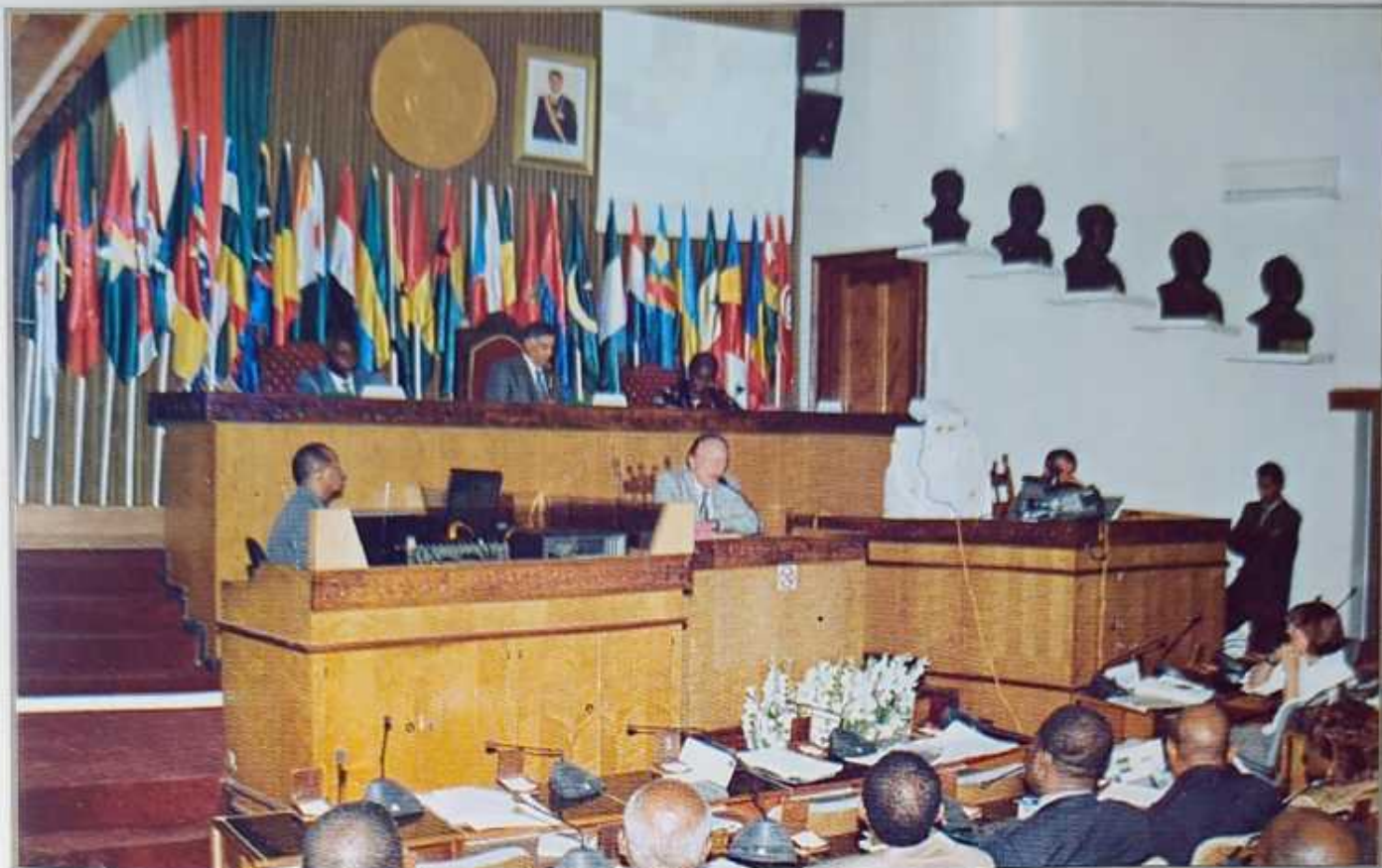
Vue de la Salle des Séances lors de la Cérémonie d'ouverture de la XVIème Assemblée Régionale Afrique de l'APF, le 14 mai 2008

En République Démocratique du Congo, les Institutions sont actuellement mises en place, mais le climat est toujours tendu dans la province de l'Est, près des frontières avec l'Ouganda, le Rwanda et le Burundi avec des interférences des groupes armés. On y dénombre plus d'un million de déplacés de guerre et des centaines de milliers de femmes victimes de viols.