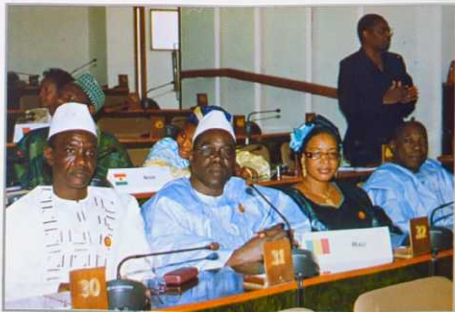
La délégation de l'Assemblée nationale du Mali

Un exposé très riche en information, car l'intervenant a d'abord commencé par poser le problème dans ce contexte tout en citant des auteurs célèbres comme Bernard CASSEN, Amadou Hampaté BA avec son ouvrage portant sur les aspects de la civilisation africaine.