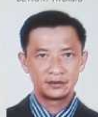
RAJAONARY Eistein ATSIMO-ATSIANANA MIDONGY ATSIMO