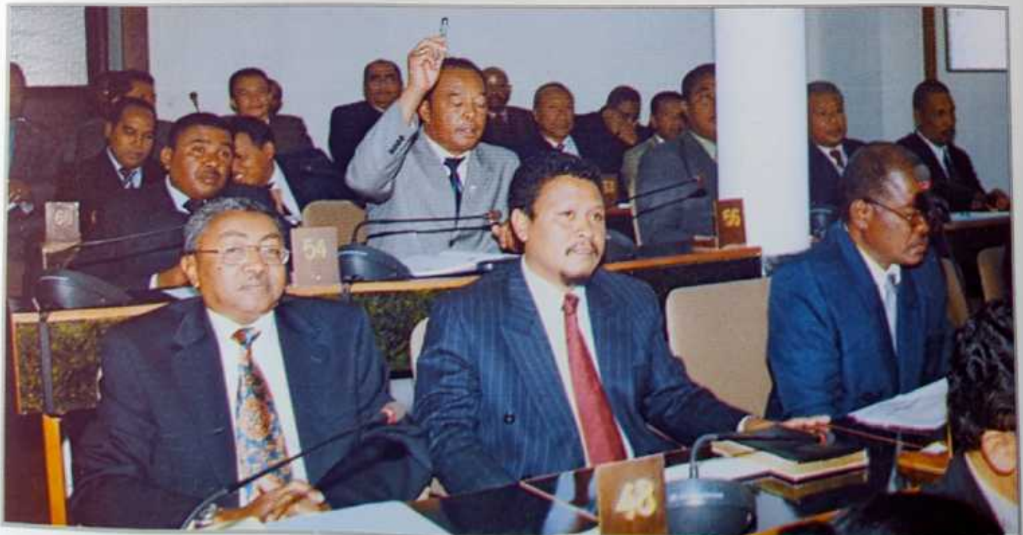
La parole aux Députés lors de la Séance de Présentation du Rapport du Gouvernement