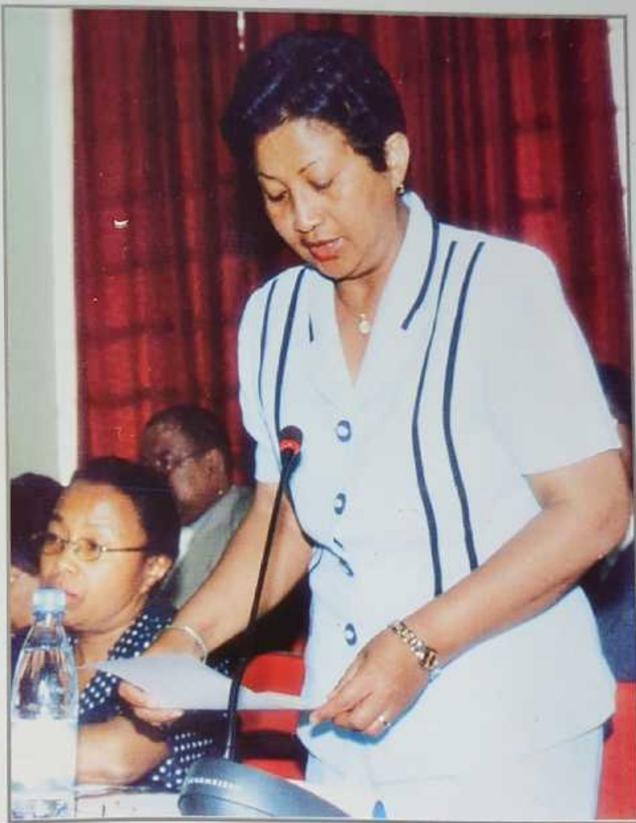
Le Ministre de la Justice, Madame Bakolalao RAMANANDRAIBE RANAIVO HARIVONY

- elle accorde une importance à la formation technique. En effet, celle-ci sera