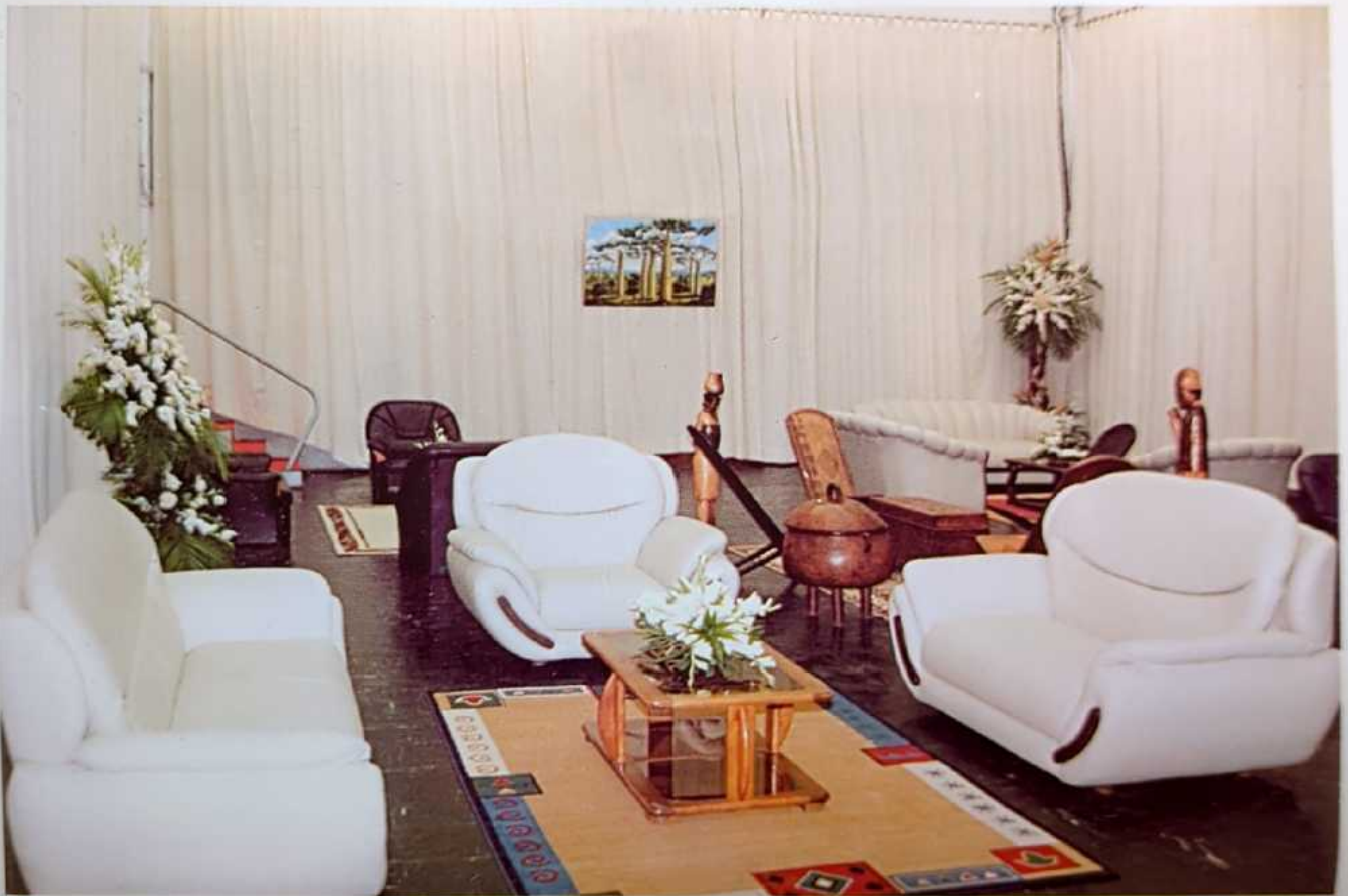
« Le Patio »