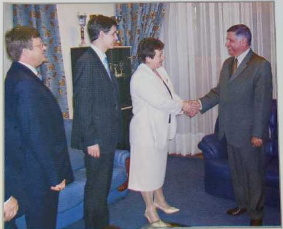
Madame SVETLANA Y. ORLOVA, Vice - Présidente du Conseil de la Douma d'Etat de la fédération de Russie, accompagnée par SEM L'Ambassadeur de Russie, a effectué une visite de courtoisie auprès du Président de l'Assemblée nationale, Monsieur Jacques SYLLA