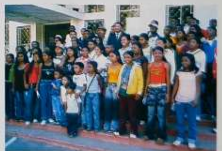
Ny Filohan'ny Antenimierampirenena eo afavoan'ny mpianatra nitsidika azy

Naneho ny hafaliany ny Filoha MAHAFARITSY tamin'ny nandraisany ireto mpianatra ireto ka nahafahany nanazava ny firafitry ny Antenimierampirenena sy ny asany. Nambarany fa misokatra ho an'ny