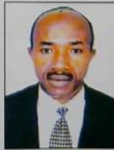
TOVOHERIHAVANA Philibert Inspecteur Général de l'Assemblée nationale