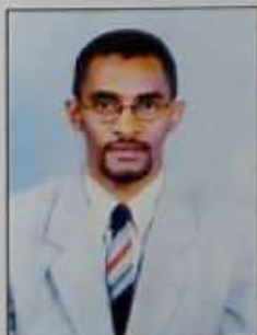
JEANNOT DE MATA Inspecteur Général de l'Assemblée nationale