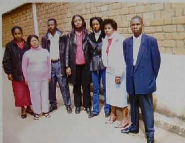
Les fonctionnaires rattachés à l'Inspection Générale de l'Assemblée nationale

l'Assemblée nationale a pour missions principales d'effectuer des activités d'inspection, de vérification et de contrôle sur le fonctionnement des services de l'Assemblée nationale. A ce titre, les Inspecteurs Généraux se doivent de :