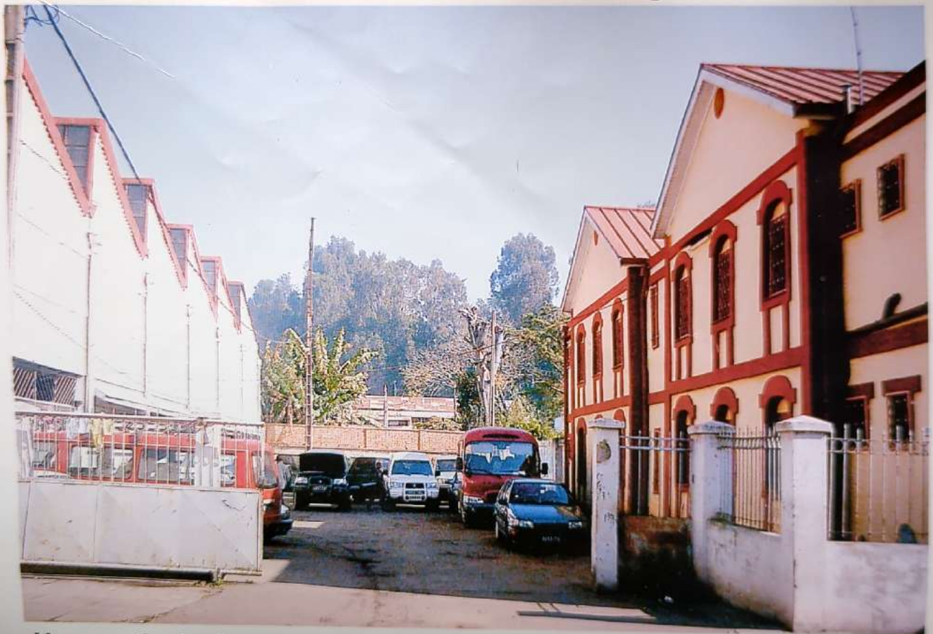
Une partie du Garage (à gauche) et une partie du Centre d'accueil (à droite)