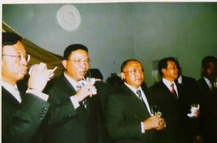
Ireo Filohan'ny Andrimpanjakana nandritra ny Lanonam-pamaranana