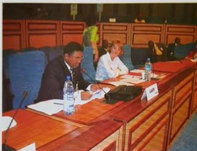
Le Président de l'Assemblée nationale lors de son intervention à la XXXIII ème AG de l'APF

La présentation par chaque Section du suivi de l'application de la CEDF a également marqué cette rencontre du Réseau des Femmes Parlementaires de la Francophonie, qui n'a pas non plus manqué de manifester sa profonde préoccupation face à la situation des femmes et des enfants au Darfour.