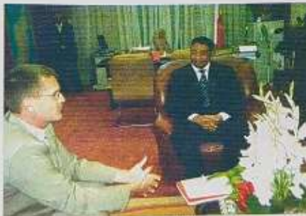
Nitsidika ny Filohan'ny Antenimierampirenena ny Solontenan'ny FFE teo aloha

miasa ho amin'ny fampandrosoana an'i Madagasikara ; faly aho, hoy ny Filoha Samuel MAHAFARITSY Razakanirina, mandray anao satria any amin'ny faritany misy ahy any dia efa ela no niarahana niaina tamin'ny teratany Karana ; nambarany fa ny Malagasy dia maheno ny lazan'i Inde indrindra amin'ny resaka informatika sy ny fiofanana mikasika izany, izay raha tanteraka eto Madagasikara, dia ho fanamafisana ny fifandraisan'ny Parlemantera Malagasy sy Indianina. Nanaiky ny fanasana nataon'ny Ambadaoron'i Inde ho amin'ny fifanakalozana traikefa eo amin'ireo Parlemanteran'ny tany roa tonta ihany koa ny Filohan'ny Antenimierampirenena. Maniry dia maniry aho, hoy izy, ny hitohizan'ny fihaonantsika matetika. Nisy ny fiarahana naka sary ho fahatsiarovana.