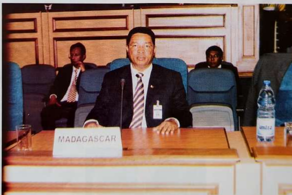
Le Président Samuel MAHAFARITSY Razakanirina, à la XXXIIIème Assemblée générale de l'APF (Libreville, Gabon, 04 juillet 2007).

Le transfert de technologie, les investissements créateurs d'emplois dans les pays du tiers monde, l'augmentation des dépenses sociales, notamment en terme de santé publique, d'éducation et d'enseignement sont autant de solutions pour éviter le phénomène de flux migratoire préjudiciable au pays d'accueil.