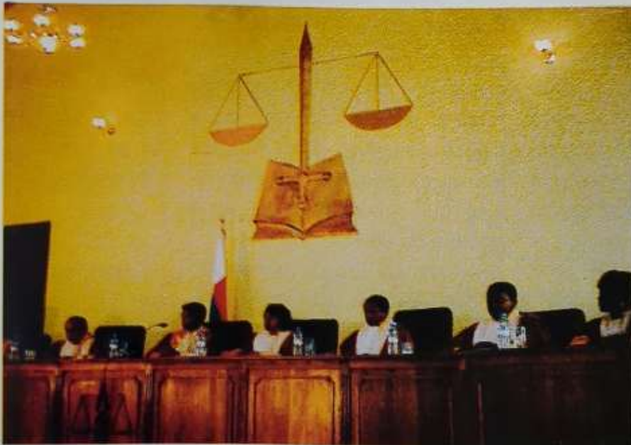
Les membres de la Haute Cour Constitutionnelle, en audience

et par conséquent, de permettre une meilleure planification de l'ordre du jour des Assemblées. Cependant, la réduction de la durée des sessions pourrait avoir un impact négatif sur la qualité des lois qui seraient alors examinées à la hâte ainsi que multiplier le nombre des sessions extraordinaires pendant les périodes de profusion des textes à examiner. Corollairement à cette réduction de la durée des sessions, la durée d'examen de la loi de finances par le Parlement a été également réduite à 40 jours au maximum (contre 60 jours auparavant) répartis à 15 jours identiquement pour chacune des deux chambres en première lecture et à 5 jours en deuxième lecture.