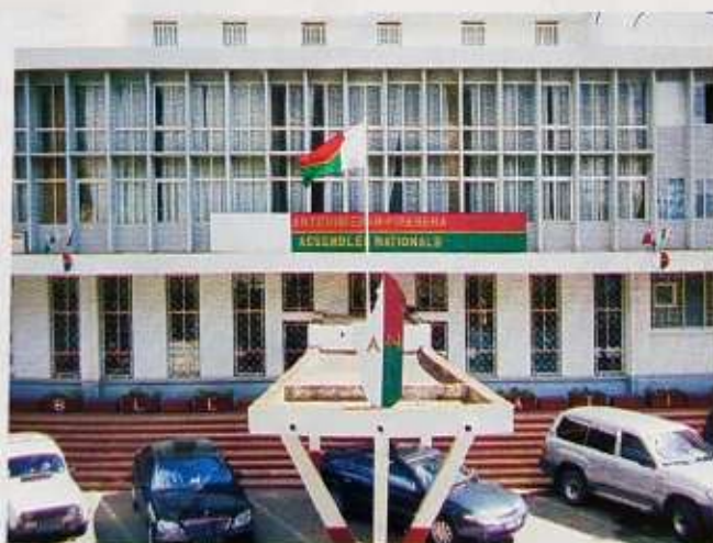
Assemblée nationale de Madagascar

Deuxièmement, le cas de « flagrant délit » qui conditionne les arrestations sans autorisation préalable de l'Assemblée pour délit ou crime commis en période de session n'ont pas été repris mais ont été restrictivement définis indépendamment des définitions consacrées par l'article 206 du Code de Procédure pénale.