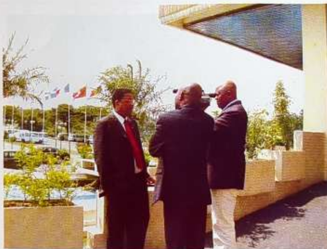
Le Président de l'Assemblée nationale, interviewé par les journalistes de la TV nationale de la RDC juste après la réadmission de ce pays au sein de l'APF