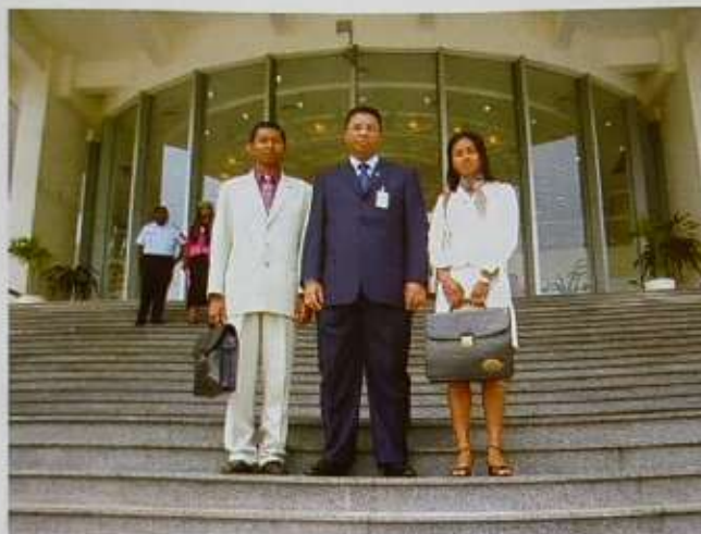
Nos deux jeunes parlementaires entourant le Président de l'Assemblée nationale

La IV ème session du Parlement Francophone des Jeunes a débuté le 2 juillet 2007 par une séance préparatoire dans laquelle le Comité d'organisation a donné des explications sur la procédure à suivre et les règles classiques applicables au déroulement de tout débat parlementaire, notamment les modalités de prise de parole, de votes, de comportement à adopter, ... Sur ce point, on a surtout souligné la pleine indépendance des jeunes parlementaires dans l'accomplissement de leur mission à Libreville.