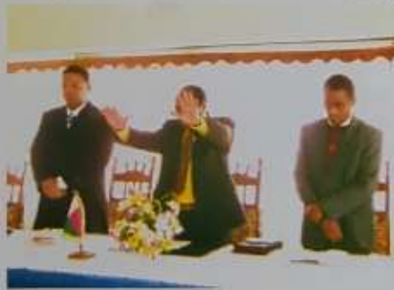
Fotoam-pivavahana tao amin'ny efitranon'ny Birao Maharitra

dia misy ireo izay tonga manotrana an'izany. Ny Filohan'ny Antenimierampirenena farany ity moa no tena matetika niara nivavaka tamin'ny vondrom-bavaka, fa izay rehetra nandalo teo kosa dia samy nanohana amin'ny