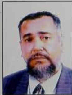
RAYMOND FELICITE Inspecteur Général de l'Assemblée nationale