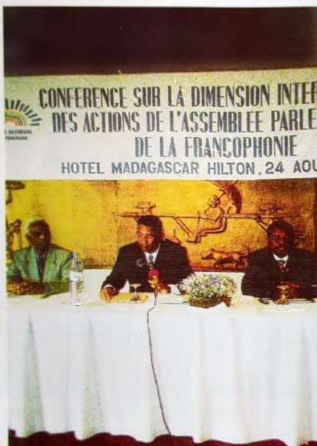
Le Président de l'Assemblée nationale, répondant aux questions de l'assistance

Aussi, des consultants et experts sont-ils recrutés pour la réalisation de guide et outils techniques assurant l'amélioration de la productivité législative des parlementaires et leur permettant d'exercer convenablement le contrôle des actions de l'exécutif.