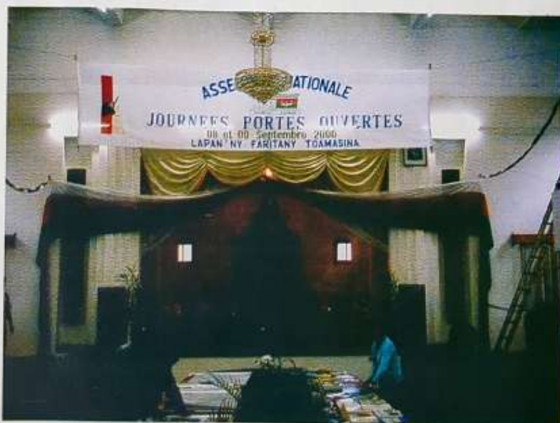
L'exposition des documents lors des Journées Portes Ouvertes à Toamasina

- Organisation des Journées Portes Ouvertes (JPO): 21 933 personnes ont pu visiter les journées Portes Ouvertes de l'Assemblée nationale, organisées dans les six chefs lieux des ex-Faritany et à Manakara. Deux autres JPO, à Antsirabe et à Morondava, n'ont pas pu être organisées à l'approche de la campagne électorale présidentielle.