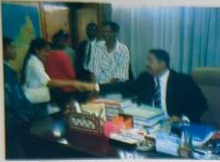
Ny Filohan'ny Antenimierampirenena, mandray tanana ny mpianatra nitsidika azy

I – Fandraisan'ny Filohan'ny Antenimierampirenena – Atoa Samuel MAHAFARITSY Razakanirina ireo Mpianatra miisa 11, solontena avy amin'ny Oniversiten'Andrainjato Fianarantsoa