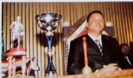
Ireo amboara manoloana ny Filohan'ny Antenimierampirenena

Lehiben'ny Sampandraharaha Ankapoben'ny Antenimierampirenena