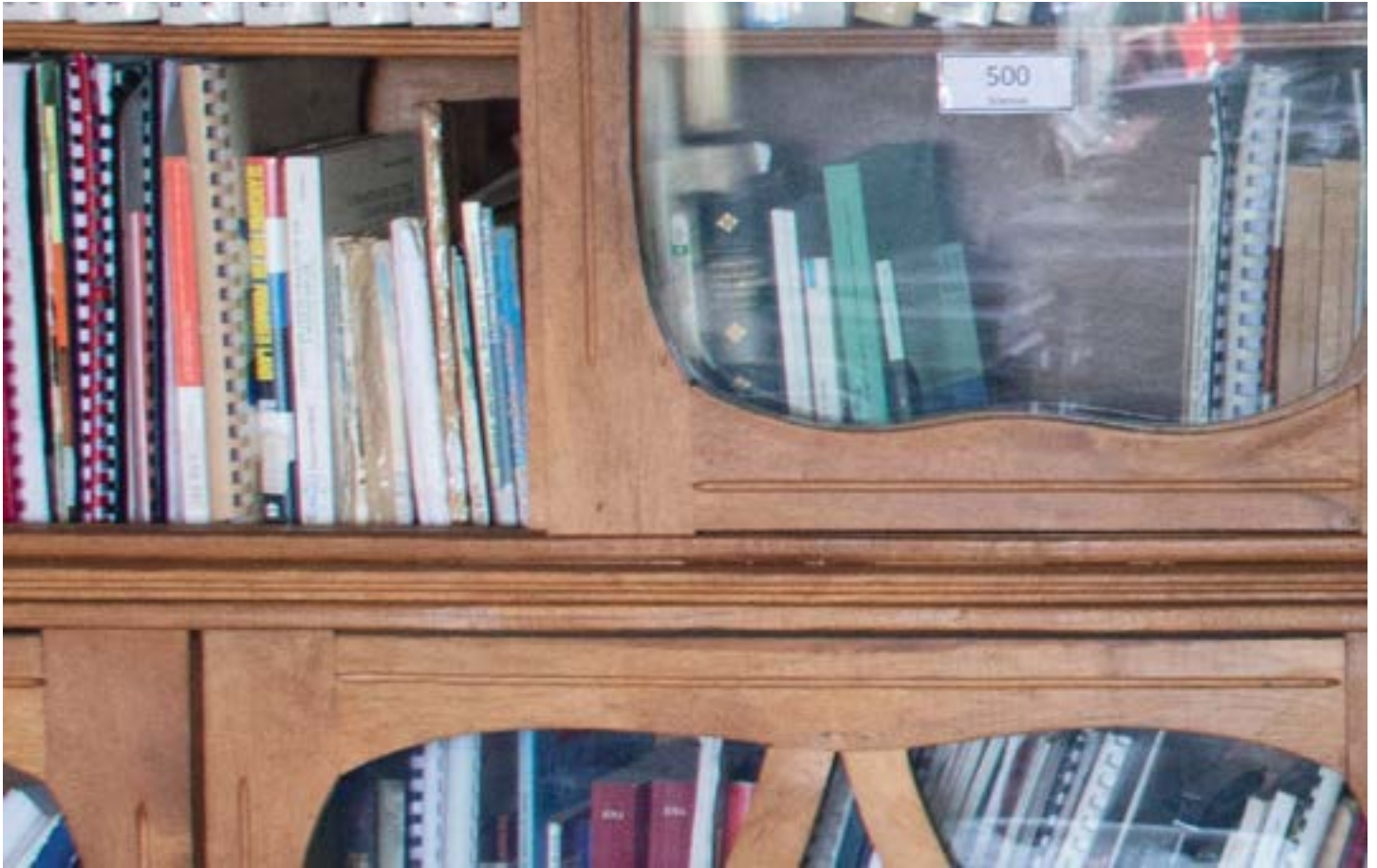
Bibliothèque de l'Assemblée nationale

septembre 1992 sur la communication audiovisuelle considère l'évolution technologique et les nouveaux besoins du monde de la presse. Ainsi, il est même créé un Haut conseil de l'audiovisuel qui est un organe de coordination et de contrôle. Il fallait attendre l'année 2016 pour que Madagascar puisse se doter d'un code de la communication médiatisée digne de cette appellation. C'est la Loi 2016-029. Une autre structure, l'Autorité Nationale de Régulation de la Communication Médiatisée (ANRCM), remplace le premier. Selon l'exposé des motifs « Sa mission principale est de réguler les activités du secteur de la communication médiatisée. ». Les peines d'emprisonnement ne subsistent plus tandis que les lourdes peines d'amende risquent de « tuer » les entreprises de média (généralement privées) jugées fautives.