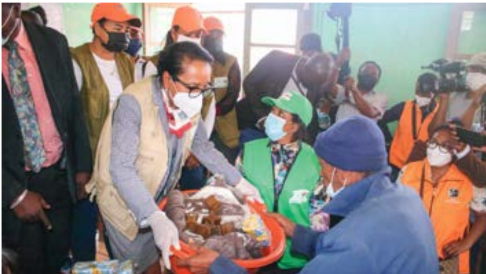
Les femmes parlementaires au chevet des sinistrés du site d'Ambohipo