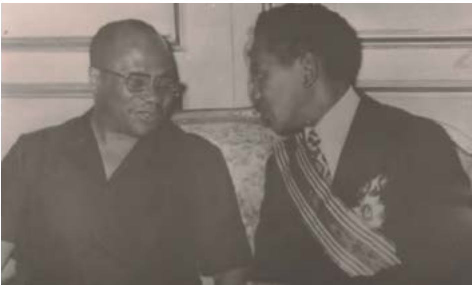
Pasitera Andriamanjato sy ny Filohan'ny Libéria Tolbert Junior

Noho ny tolona nandraisan'i Pasitera anjara ho fanafahana an'i Afrika dia notoloran'ny Filohan'ny Liberia Tolbert Junior ny "Grand Croix de la Liberia" izy . Marihina fa herinandro taorian'ny nanomezana io mariboninahitra io an'i Pasitera dia nisy nitifitra io Filoham-pirenena io. Ary marihina fa Pasitera ihany koa izy io. Ny sary nihaonan'izy mirahalaha farany ity atolotray anao ity, izay fotoana nanomezany medaly an'i Pasitera Andriamanjato Richard Mahitsison.