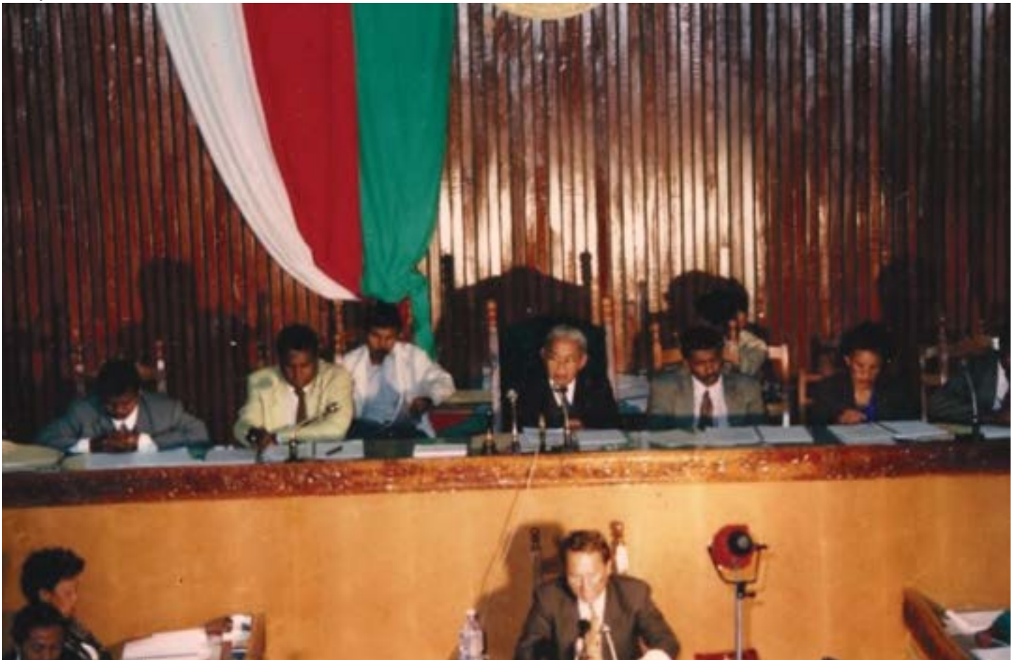
Fitarihana fivorian'ny Antenimierampirenena

Rehefa tafatsangana izany dia voafidimbahoaka sy ny solombavambahoaka ho Filohan'ny Antenimierampirenena i Pasitera ny taona 1993 hatramin'ny 1998. Tsy mora akory ny nitantana izany andrimpanjakana izany fa nohon'ny hevitra tsy mitovy teo amin'ireo mpikambana dia nisy matetika ny korontana, nefa nohon'ny fanetren-tena sy fahaiza-mandamina nananan'i Pasitera dia vetivety izany dia nilamina, tsy sasatra izy nanambara fa "Andriamanitra tsy tompon'ny fikotranana fa mpanjakan'ny fiadanana sy ny filaminana."