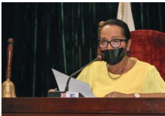
La Présidente de l'Assemblée nationale lors de la cérémonie de clôture de la deuxième session ordinaire 2021

Dans son discours lors de la cérémonie de clôture de la session budgétaire d'octobre-décembre 2021, la Présidente de l'Assemblée nationale évoquait des perspectives nationales, du moins ses attentes pour cette année. Entre amélioration des conditions sociales du peuple et élaboration du code minier en passant par l'arrêt des querelles internes du Gouvernement, des actions immédiates et à court terme de la part du Gouvernement sont requises.