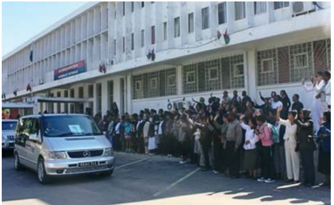
Sombiny tamin'ny sary fanaovam-belona farany azy teto amin'ny Antenimierampirenena