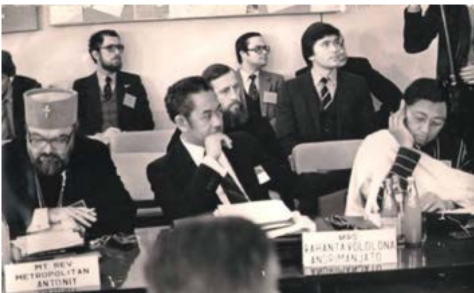
Pasitera Andriamanjato mivady manatrika fivoriana iraisam-pirenena

Nahazo diplaoma ambony arak'izany i Pasitera satria nekena hanohy ny fandalinana avo lenta sy ny fandinihana ny hevitra samihafa izay mifandray amin'ny asan'ny fiangonana sy ny fijoroany eo anivon'izao tontolo izao ary nekena hampianatra tao amin'ny akademia tamin'ireo firenena izay nanome azy izany, dia i Hongrie nanome ny " Docteur Honoris Causa" tamin'ny taona 1972, Tchecoslovaquie nanome ny " Docteur Honoris Causa de la faculté de Théologie Comenius de Prague" tamin'ny taona 1978, ary Inde nanome ny « Docteur en Philosophie de l'œcuménisme social de l'Académie culturelle de Parthasarathy à Madras» tamin'ny taona 1985. Izay no nahatonga azy ho Révérend Docteur Andriamanjato Richard Mahitsison.