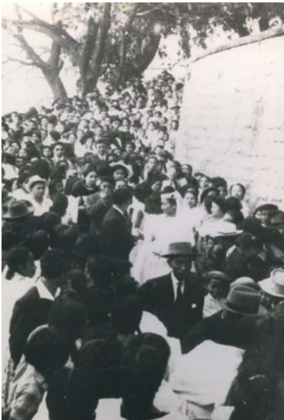
Sombiny tamin'ny sary mariazy

kanjo resy izany. Ary tamin'io taona io ihany koa, tamin'ny 18 Oktobra 1958 no natao ny mariazin'izy mivady tao Ambohitantely. Mariazy izay nanantantara be teto Madagasikara satria natrehan'ny vahoaka aman'arivony izay nampahery sy nampifaly azy mivady tokoa.