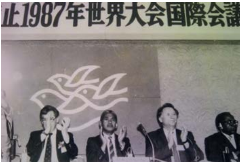
Fivorian'ny CCP tamin'ny taona 1987

Tsy mari-pototra anefa ny fahafahana raha tsy misy ny fandriampahalema izay mbola takian'izao tontolo izao mandraka ankehitriny. Izany dia mitaky ny fahafahana amin'ny endriny maro. Nandray anjara mavotrika tamin'izany izy mivady ary nanangana ihany koa ny Konferansa Kristiana Afrikana momba ny Fandriampahalemana na ny Conférence Chrétienne Africaine Pour la Paix niara-niasa tamin'ny Konferansa Kristiana Malagasy momba ny Fahandriampahalemana na ny Conférence Chrétienne Malgache Pour la Paix izay izy mivady no nitarika an'ireo izay lasa mpikamban'ny C.C.P. na Conférence Chrétienne pour la Paix. Tamin'ny alàlan'ny C.C.P. no nampihavanana ireo fiangonana kristiana tany Eropà Atsinanana sy Eropà Andrefana ka nahafahana nampiray ny firenena tandrefana sy ny tatsinanana tamin'ny alàlan'ny kristiana. Ary koa nahafahana nampijanona ny fifaninanana ara-pitaovam-piadiana teo amin'ireo firenena matanjaka tsy hipoahan'ny ady lehibe fahatelo tamin'izany.