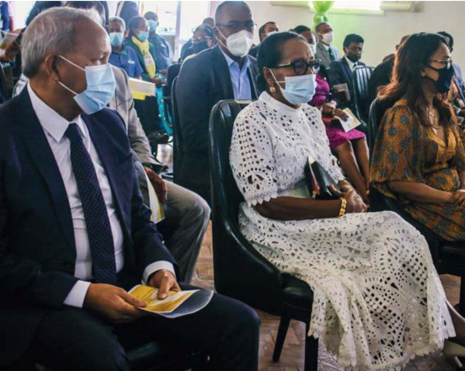
Fanompoam-pivavahana natao ny 15 desambra 2021 ho fanamarihana ny faha-20 taonan'ny vondrom-bavaka

Notanterahina tamin'ny faha-15 desambra 2021 ny fankalazana ny faha-20 taona nitsanganan'ny vondrom-bavaka sy ny fametrahana ny vato fototry ny trano natokana hivavahana «Nehemia» eto amin'ny Antenimierampirenena.