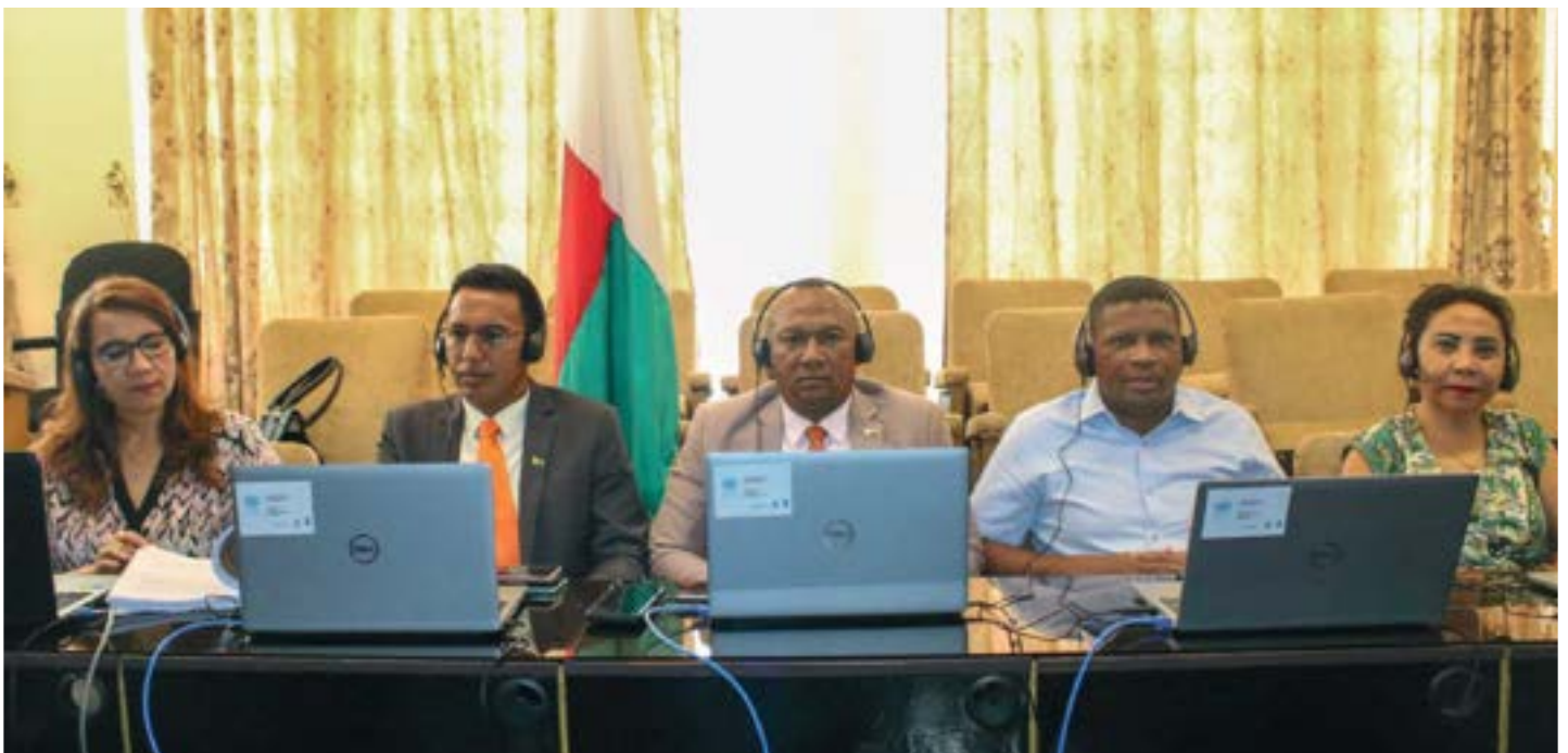
Fivorian'ny FP-SADC ny 15 ka hatramin'ny 17 novambra 2021 nandinihina ny lalàna lasitra momba ny VBG