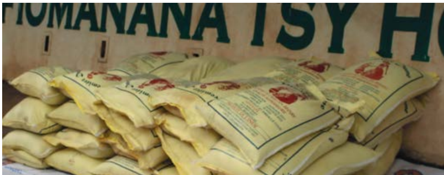
Dons remis aux sinistrés d'Antananarivo, le 21 janvier 2022

Madagascar fait partie des pays considérés comme très vulnérables aux impacts du changement climatique. En effet, depuis quelques années, la Grande Ile a été constamment affectée par l'alternance d'évènements climatiques extrêmes : d'importantes sécheresses et d'aridités observées dans la partie sud et de fortes précipitations qui ont presque touché l'ensemble du territoire national.