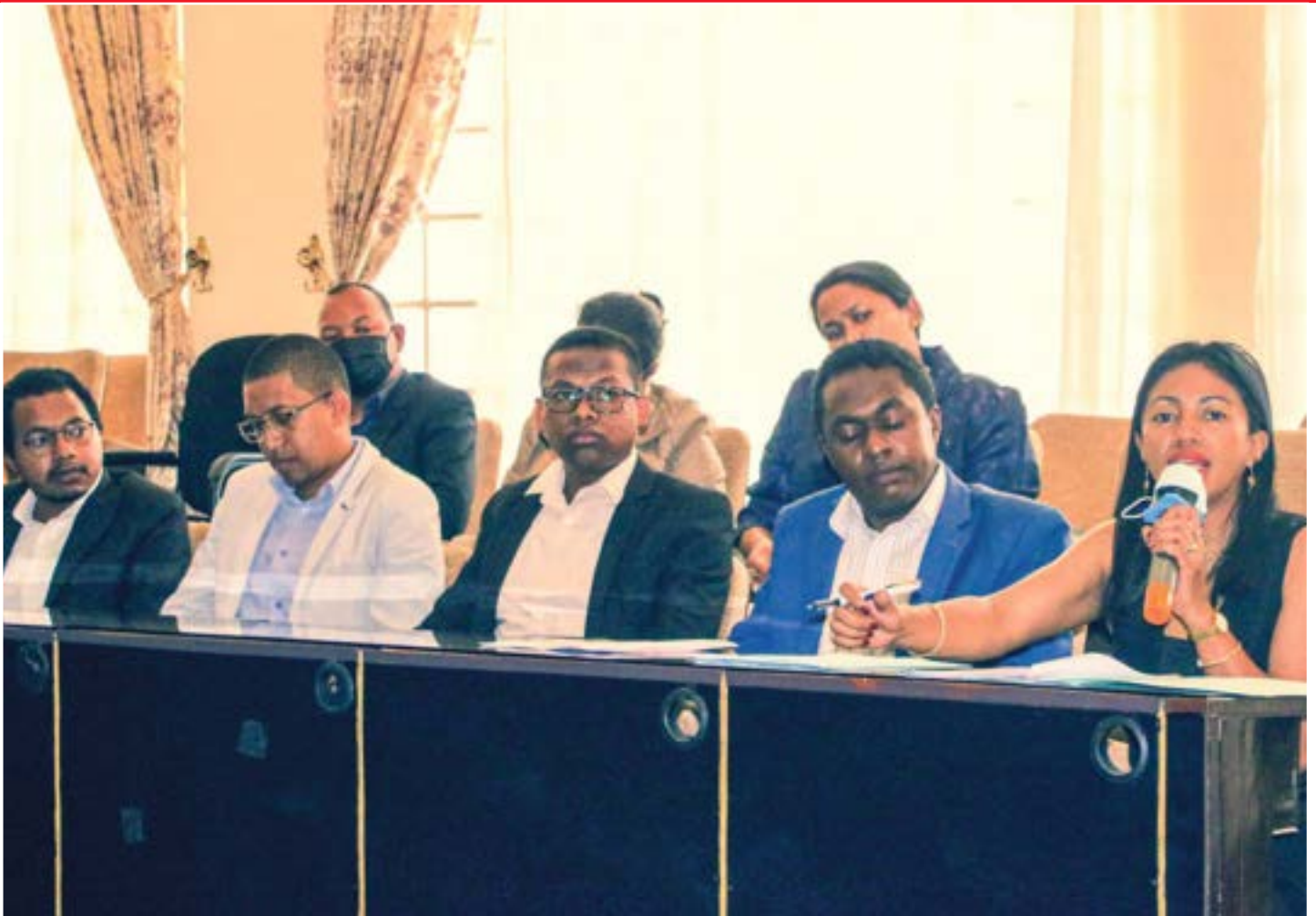
La Ministre de la Communication et de la Culture présentant la Charte de la renaissance culturelle africaine devant les Députés de Madagascar, le 28/10/2021.

l'Afrique et recommandent sa large diffusion y compris dans les langues africaines, en outre la publication de versions abrégées et simplifiées de l'histoire pour le grand public.