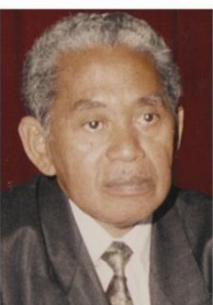
Pasteur ANDRIAMANJATO Richard Président de l'Assemblée Nationale 8 Août 1993 - 1998

Les élections législatives du 16 juin 1993 a permis de remettre en place l'institution législative malgache. La première législature de cette troisième République a vu l'existence d'une multitude de partis politiques : Mouvance Présidentielle [CFV, CSCD, UNDD, AKFM Fanavaozana, CSDDM, ACCORD, FARIMBONA, GRAD-Iloafo, VATOMIZANA] 75 sièges - Parti Militant pour le Développement de Madagascar (PMDM) 15 sièges - LEADER-Fanilo 13 sièges - FIVOARANA 02 sièges - RPSD 08 - FAMIMA 11 - Autres 10 sièges - Vacants 04 sièges. La majorité y était difficile à trouver, c'est-à-dire que la majorité des tendances dépend de la situation politique existante. C'est pourquoi à l'époque, on parlait de « majorité à géométrie variable ». Le Pasteur Richard Andriamanjato Mahitsison était à la tête de ce premier mandat qui a duré cinq ans (1993-1998).