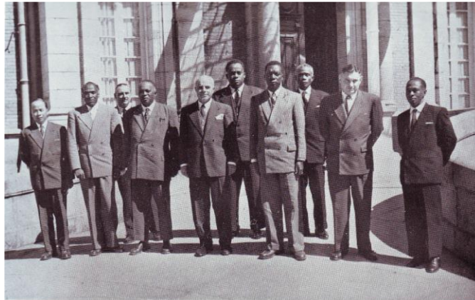
LE PREMIER CABINET MALGACHE FORMÉ LE 29 MAI 1957 : ON RECONNAÎT LE PRÉSIDENT TSIRANANA AYANT, À SA GAUCHE, M. ANDRÉ SOUCADAUX

Le premier cabinet malgache dénommé «Conseil de Gouvernement», naquit le 29 mai 1957. M. André Soucadaux (Haut-commissaire de la République française, Chef du territoire) devenait de droit Président, et M. Tsiranana Philibert (Député de la province de Majunga à l'Assemblée nationale française) était le Vice-Président. Une «Assemblée Représentative» élue au suffrage universel chargée de voter le budget et d'élire les ministres du Conseil de Gouvernement sur lesquels elle pouvait exercer un certain contrôle fût aussi instaurée.