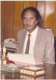
Lucien Xavier Michel ANDRIANARAHINJAKA Président de l'Assemblée Nationale Populaire 1977 - 1991

Monsieur Michel-Andrianarahinjaka Lucien Xavier, membre fondateur et membre du bureau politique de l'AREMA -ancien Ministre Conseiller à la Présidence de la République -Député élu dans le Fivondronana de Fianarantsoa-II, fût élu Président de l'Assemblée nationale populaire en 1977. Le bureau de l'Assemblée Nationale Populaire était composé d'un Président, de cinq Vice-Présidents et de deux Questeurs. Ce bureau est régi par le règlement intérieur de ladite institution dans son chapitre 2 et particulier l'article 8 qui stipule que : "Les membres du bureau sont élus pour une année, sauf ceux qui sont élus en cours d'année à l'occasion des vacances individuelles. Le renouvellement du bureau aura lieu chaque année au début de la première session ordinaire" .