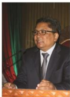
Mamy RAKOTOARIVÉLO Président du Congrès de la Transition Jean-Congrès de la Transition 2013

Le Congrès de la transition avait commencé à siéger le 13 octobre 2010. Il est composé de 256 4 membres désignés pour la période transitoire et est dirigé par son Président, Raharinaivo Andrianatoandro. La répartition des membres a été arrêtée d'un accord entre les principales forces politiques présentes à l'accord politique d'Ivato en date du 13 août 2010 qui a été approuvé par la Conférence nationale du mois de septembre 2010. La représentation de l'ensemble de la classe politique malgache était l'objectif de cette répartition : anciens députés appartenant au parti TIM, des membres de l'AREMA et du HPM (Union des Forces Politiques) et autres représentants des forces vives et de la société civile.