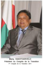
Mamy RAKOTOARIVÉLO Président du Congrès de la Transition en charge de la Transition 2009

Les événements politico-sociaux du mois de décembre 2008 entraînent de nouveau la suspension de l'Assemblée nationale . Les parlementaires n'ont pas pu exercer leurs fonctions durant cette période. L'accès d'Andry Nirina Rajoelina à la tête de la transition amena le régime en place à la Charte de Maputo I, Maputo II, convention d'Addis Abbeba et Maputo III. Ces différentes conventions ont permis l'instauration du Congrès de la Transition à la place de l'Assemblée nationale, avec Rakotoarivelo Mamy (ex-Vice-Président de l'Assemblée nationale) aux commandes. La passation de commandement entre l'ancien Président de l'Assemblée nationale, Maître Jacques Sylla, et le nouveau maître des lieux, Monsieur Mamy Rakotoarivelo, s'est effectuée le 12 novembre 2009 au palais de Tsimbazaza. Cependant, toutes ces ententes se sont terminées par un fiasco et le Congrès de la Transition fut dissout par le Président de la Transition, Andry Rajoelina, ainsi que les autres institutions instaurées avec lui.