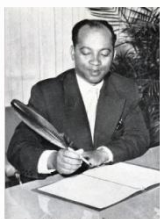
Norbert ZAFIMAHOVA Président de l'Assemblée Constituante 1958 - 1959

Les Assemblées provinciales et représentatives élues sous la loi cadre fusionnent en 1958 pour former l'Assemblée nationale constituante. Le 16 Octobre 1958, ses membres choisissent Norbert Zafimahova à la tête de la nouvelle chambre ainsi créée. C'est sous sa direction que les débats sur les futurs statuts de la Grande Ile sont menés. Prétendant à la course à la Présidence de la République en même temps que M. Philibert Tsiranana, il est toutefois invité par ce dernier à faire partie de la délégation négociant le transfert des compétences en 1960.